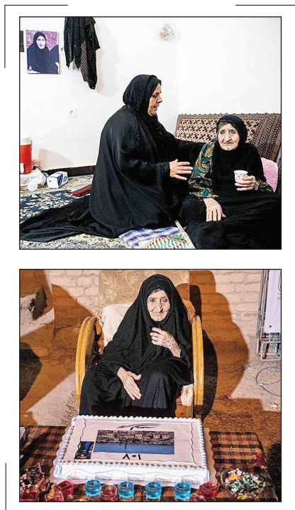
تولد ۱۰۷ سالگی بی‌بی «لوعه»

بی‌بی «لوعه» کهنسال ترین زن خوزستان متولد ۴ تیر ۱۲۹۴ است. او حوادث زیادی را با چشم خود دیده: از هجوم انگلیسی‌ها تا حمله عراق و حصر آبادان. او که به مادر رزمندگان دفاع مقدس مشهور است، هم‌زمان با آغاز جنگ تحصیلی و در شرایطی که شهر دارخوین خالی از سکنه می‌شود، در دارخوین می‌ماند و همراه با پسرانش به پخت نان و غذا و شستن لباس‌های رزمندگان مشغول می‌شود.