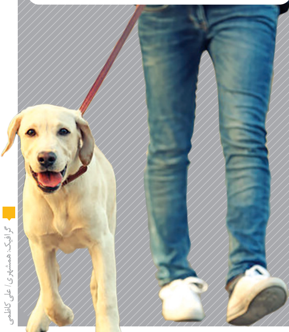
گرافیک: همشهری / علی کاطلی