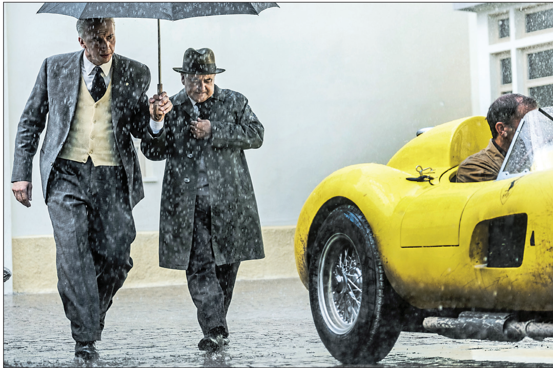
«فراری» ساخته مایکل مان از مهم‌ترین اثری که در راه جشنواره ونیز ارسال است

از وودی آلن تا مایکل مان؛ فیلمسازان شاخص به قدیمی‌ترین فستیوال سینمایی جهان می‌آیند