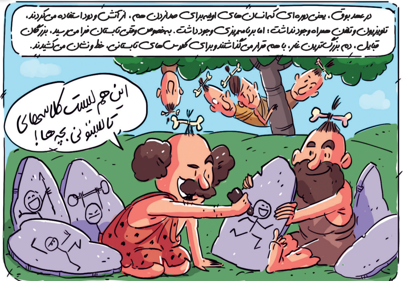
در عهد بوق، یعنی دوره‌ای که انسان‌های اولیه برای صید کردن هم، از آتش و در استفاده می‌کردند. تلویزور و تلخه همراه وجود نداشت؛ اما برنامه‌ریزی وجود داشت. به خصوص وقتیکه تابستان فرا می‌رسید، بزرگان قبایل، درم بزرگترین غار، با هم قرار می‌گذاشتند و برای کلاس‌های تابستانی، خط‌نشان می‌کشیدند.