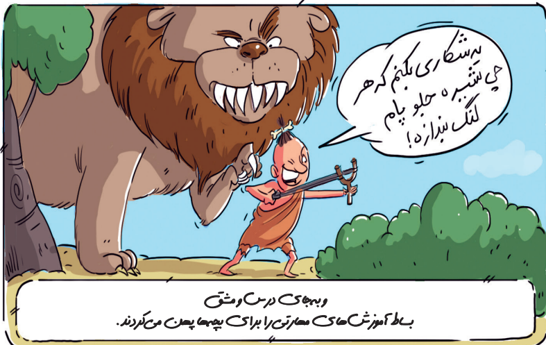
و به جای درس و مشق باط آموزش‌های مهارت‌ها را برای بچه‌ها پهن می‌کردند.