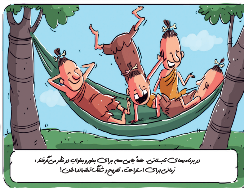
در برنامه‌های تابستان، حتماً جای هم برای بخور و بخواب در نظر می‌گرفتن؛ زمانه برای استراحت، تفریح و شنگ تهنانداختن!

دوستان عظمت‌ها معنی که انسان‌های اولیه برای برنامه‌ریزی تابستانی فرزندانشان انجام می‌دادند. این بود که در هر آن چه به علوم ریاضی و طبیعی و غیر طبیعی مربوط بود، تخته می‌کردند.