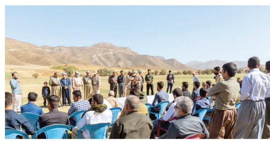
مردم سردشت همراه با مرزبانان نقش مهمی در ایجاد امنیت پایدار در این منطقه دارند.