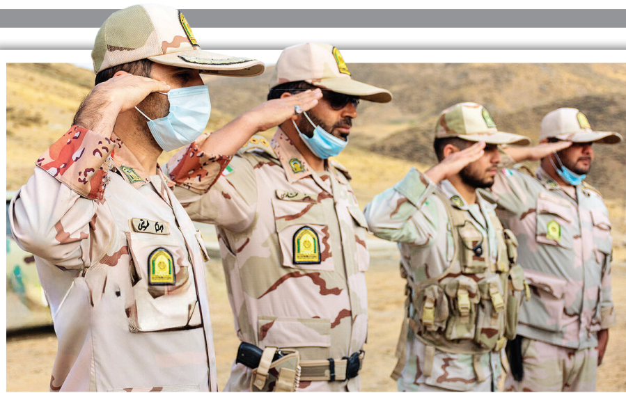
آمدیم کنار تان باشیم و بگوییم گر چه دوریم از خانه و خانواده، اما ما را چون خویش خود بدانید.

اینجا نقطه صفر مرزی، سردشت است؛ جایی در استان آذربایجان غربی و همسایگی کشور عراق. مرزبانان این هنگ مرزی، علاوه بر حفاظت از مرزهای ایران، همیشه در تعامل و سازندگی با مرز نشینان بوده اند و سعی در بهبود و آسایش مرز نشینان دارند. آنچه در ادامه می بینیم عکس هایی از قاب دوربین مهدی زوار است که به خوبی همراهی و همدلی مردم و مرزبانان را به تصویر کشیده است.