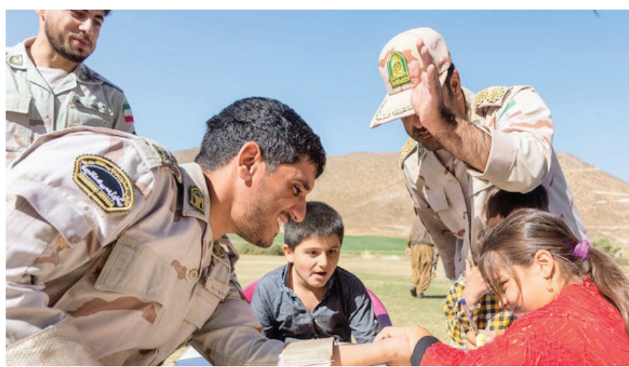
دخترم بخند و شاد باش! آینده این وطن به شادمانی تو امیدوار است و این مرزبانان اینجا هستند تا تضمینی برای خنده های تو باشند.