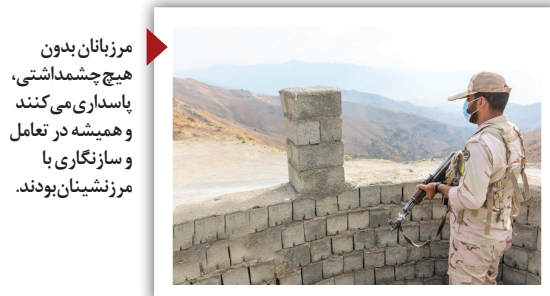
مرزبانان بدون هیچ چشمداشتی، پاسداری می کنند و همیشه در تعامل و سازندگی با مرز نشینان بودند.