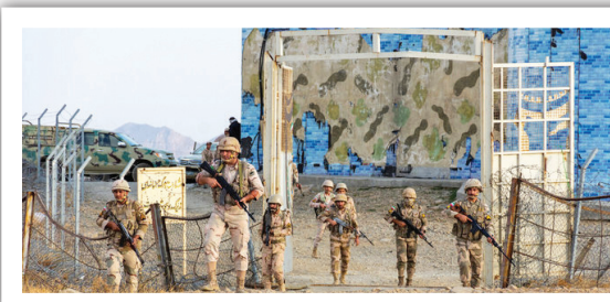
با تجهیز و به روز شدن تجهیزات مرزبانی شاهد مرزبانی هوشمند در نوار مرزی جمهوری اسلامی ایران هستیم.