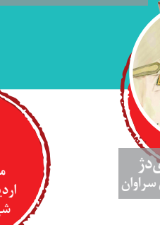
شهید یونس سیفی نژاد محل شهادت: هنگ مرزی سراوان