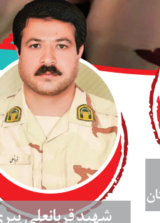
شهید قربانعلی پیری محل شهادت: هنگ مرزی زابل