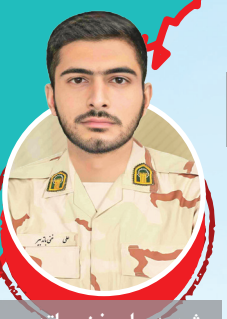
شهید حسن یادامکی محل شهادت: هنگ مرزی سراوان