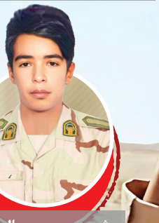
شهید علی غنی باتدبیر محل شهادت: هنگ مرزی سراوان