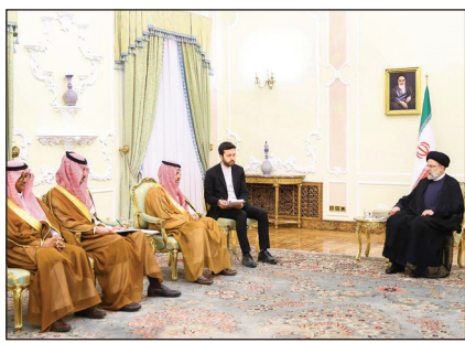
رئیس‌جمهور خطاب به وزیر امور خارجه عربستان: