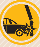
خسارت به خودرو