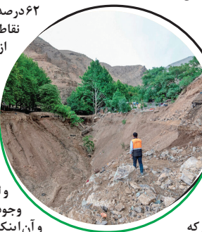
حتم ایمنی قابل توجهی در طول محور حاکم خواهد شد.

درصد پل‌های مورد ارزیابی از آسیب‌پذیری بالا برخوردار هستند که عمده آسیب‌های آنها شامل خردشدگی، نهم‌زدگی و شورزدگی ناشی از تراوش و نشست آب در اجزای سازهای است و در نتیجه آن، مشکلات ثانویه‌ای از قبیل یوسیدگی و تخریب بتن ایجاد شده است که اقدامات و بازیاری را می‌طلبد. طول جاده چالوس که در استان البرز قرار دارد، حدود ۷۰ کیلومتر است و حد فاصل کرج تا محدوده تونل کندوان را در برمی‌گیرد. این محور در یک وضعیت دراز قرار گرفته است و اغلب گذر آن از دامنه‌ها و پال‌های شیب‌دار امتداد می‌یابد. بیشترین شیب با توجه به مشاهدات میدانی در امتداد محور جاده مربوط به منطقه کندوان و قبل از آن است. در این محور ۲۷۶ مورد نقطه حادثه‌خیز ثبت شده است. بخشی از این جاده که در استان مازندران قرار دارد، حد فاصل تونل کندوان که ابتدای حوزه استحفاظی استان مازندران است، تا چالوس را شامل می‌شود. طول این محور در حدود ۱۶۰ کیلومتر است. در