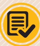
تخمین اعتبار بازسازی