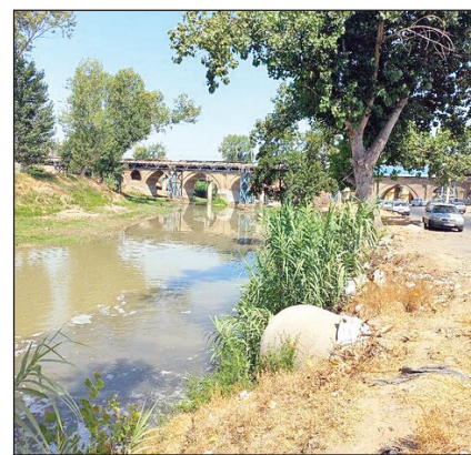
احیای بابل رود زیبا

لایروبی یک کیلومتری رودخانه بابل رود که در فروردین ۹۸ انجام شد، در کاهش خسارت ناشی از سیلاب بسیار اثر بخش بود و حالا ساماندهی بابل رود در دستور کار قرار گرفته است.