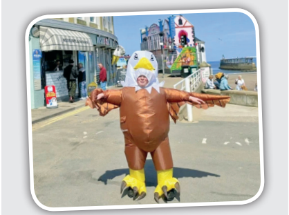
عقاب پلاستیکی در نمایشگاه