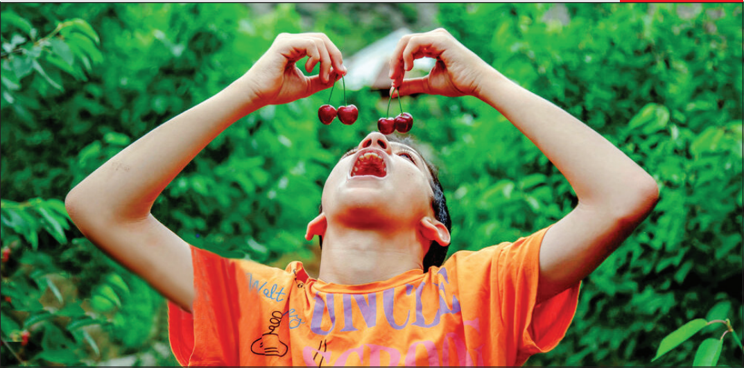
برداشت گیلاس در روستای نندین