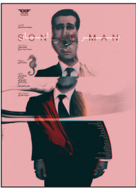
پوستر فیلم «پسر انسان»