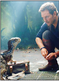
جیمز کامرون در کنار دایناسور

سی‌امین سال برگرداندن دایناسورها به زمین دارد. در بیانیه رسمی این برنامه‌ها آمده است: در هر ۲۸ساحل آمریکا، امسال تابستان مهمانان پارک موضوعی می‌توانند یکی از بزرگ‌ترین ماجراجویی‌های سینمایی را با کارهای انحصاری، غذاها و نوشیدنی‌های ویژه و نمایش فیلم نمادین ۱۹۹۳، جشن بگیرند. در پارک موضوعی اولاندو، گردشگران تجربه‌های هیجان‌انگیزی با الهام از این مجموعه رازندگی می‌کنند. در روزهای ۹، ۱۰ و ۱۱ ژوئن هم یونیورسال این فیلم را در پارک‌های خود به نمایش درمی‌آورد تا به این فیلم برجسته خود ادای احترام کند. «پارک ژوراسیک» نخستین بار ۱۹ژوئن ۱۹۹۳ در واشگتن به نمایش درآمد و از ۱۱ژوئن اکران رسمی‌اش در آمریکا شروع شد. این فیلم در اکران اولیه‌اش بیش از ۹۱۴ میلیون دلار فروخت و بدل به پرفروش‌ترین فیلم تاریخ شد و رکوردش تا زمان اکران «تایتانیک» در سال ۱۹۹۷ دست نخورده ماند. در ماه اکتبر هم در سراسر بریتانیا تور کنسرتی می‌گزارد و فیلم در مکان‌هایی از منچستر، بیرمنگام، لیدز و… نمایش داده می‌شود. فیلم استیون اسپیلبرگ که سال ۱۹۹۳ ساخته شد روز چهارشنبه ۱۸اکتبر در «ای آر نا»ی منچستر به نمایش درخواهد آمد و پس از آن به شهرهای دیگر می‌رود. تمامی نمایش‌ها را رکستر رسمی با موسیقی آهنگساز آمریکایی جان ویلیامز همراهی خواهد کرد.