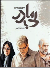
پوستر فیلم «بی‌مادر»