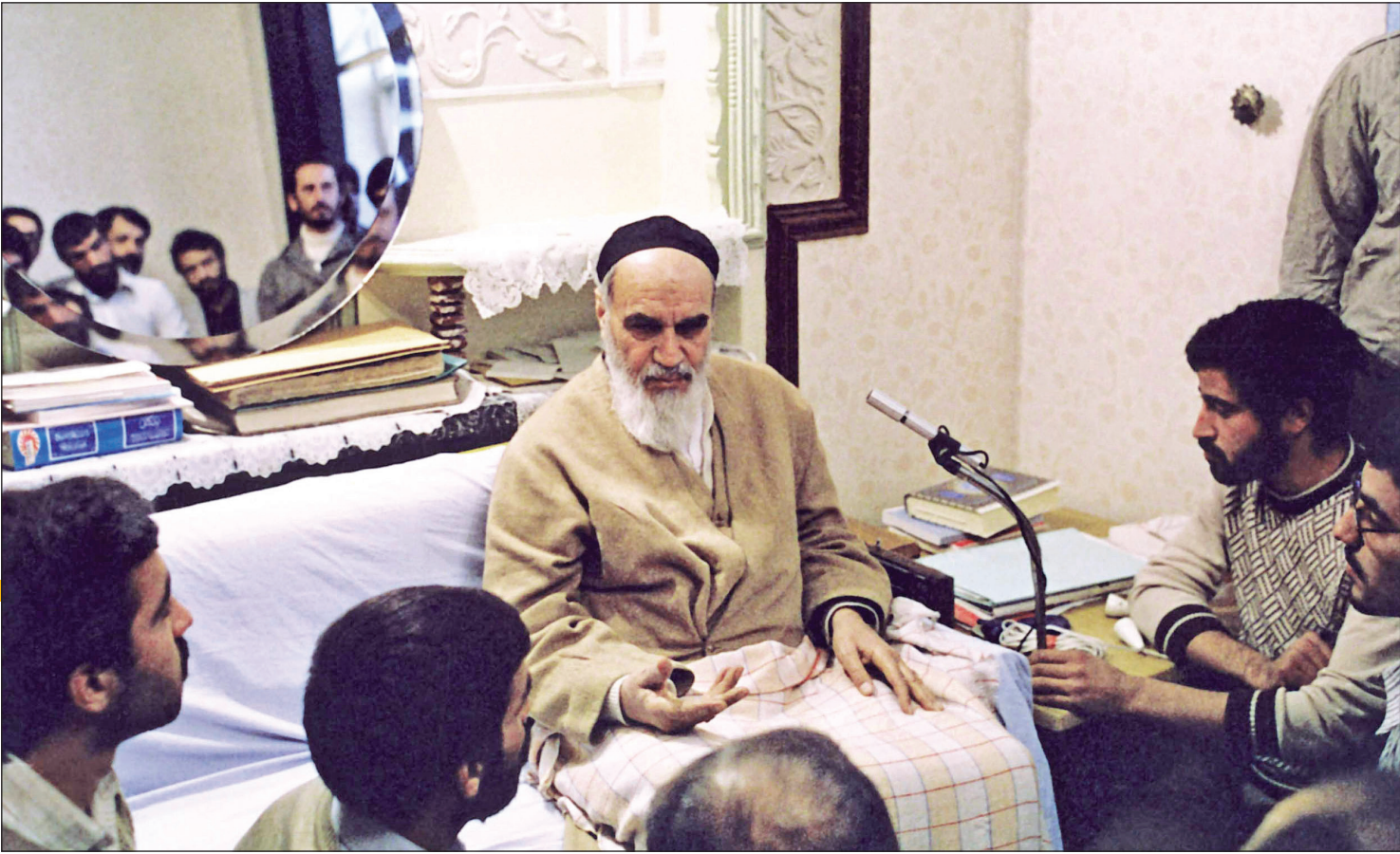
تصویر دیدار امام (ره) با پرسنل صداوسیما

تولید آثار فرهنگی و هنری بعد از انقلاب مدیون و مرهون نگاه امام خمینی ره است