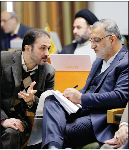
انحراف از بودجه رخ نداده است