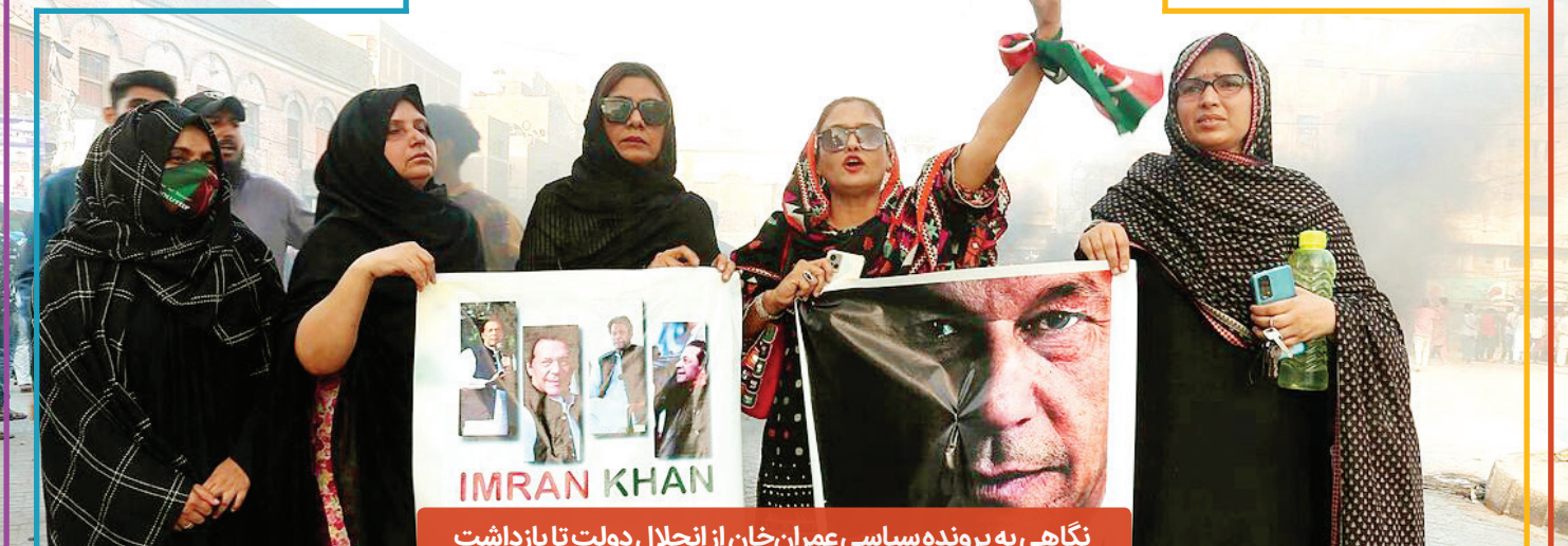
نگاهی به پرونده سیاسی عمران خان از انحلال دولت تا بازداشت