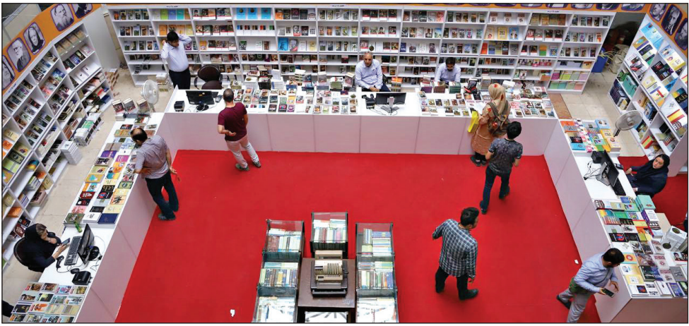
عکس همشهری از نمایشگاه

در بخش فیزیکی این رویداد ملمز به حضور در بخش مجازی نیز هستند، اما آن دسته از ناشران که برای حضور در بخش مجازی ثبت‌نام کرده‌اند، الزامی س‌رای عرضه کتاب در بخش فیزیکی ندارند. آنچه در معرض دید علاقه‌مندان به کتاب در غرفه ناشران حاضر در صلی قرار گرفته است، کتاب‌های منتشر شده از سال ۱۳۹۸ به بعد است، اما کاربران با مراجعه به سامانه نمایشگاه مجازی می‌توانند کتاب‌های منتشر شده از سال ۱۳۹۲ ناشران حاضر در این بخش را مشاهده و خریداری کنند.