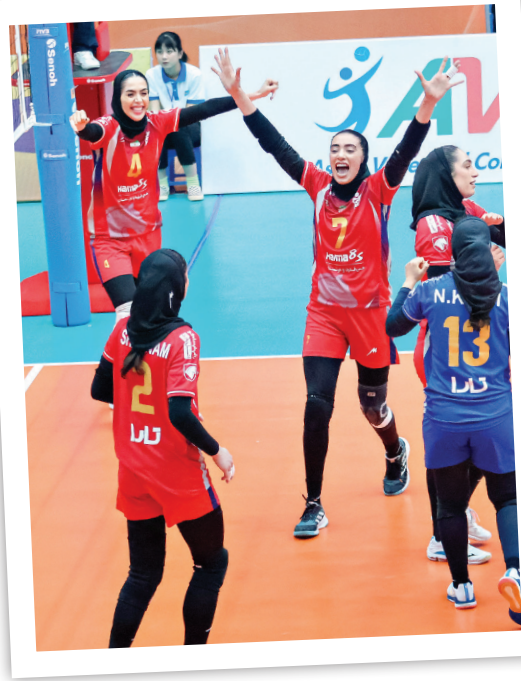
ایرانی ها شده است. سال ۲۰۲۱ سایپا به مرحله نیمه نهایی صعود کرد ولی نتوانست روی سکو برود. بارپاچ اسانس هم سال پیش همین شرایط و همین رده را تجربه کرد.

تیم های والیبال زنان ایران از سال ۲۰۰۸ در جام باشگاه های آسیا حاضر شده اند و هنوز به مدالی نرسیده اند. چهارمی بهترین رده ای بوده که نصیب