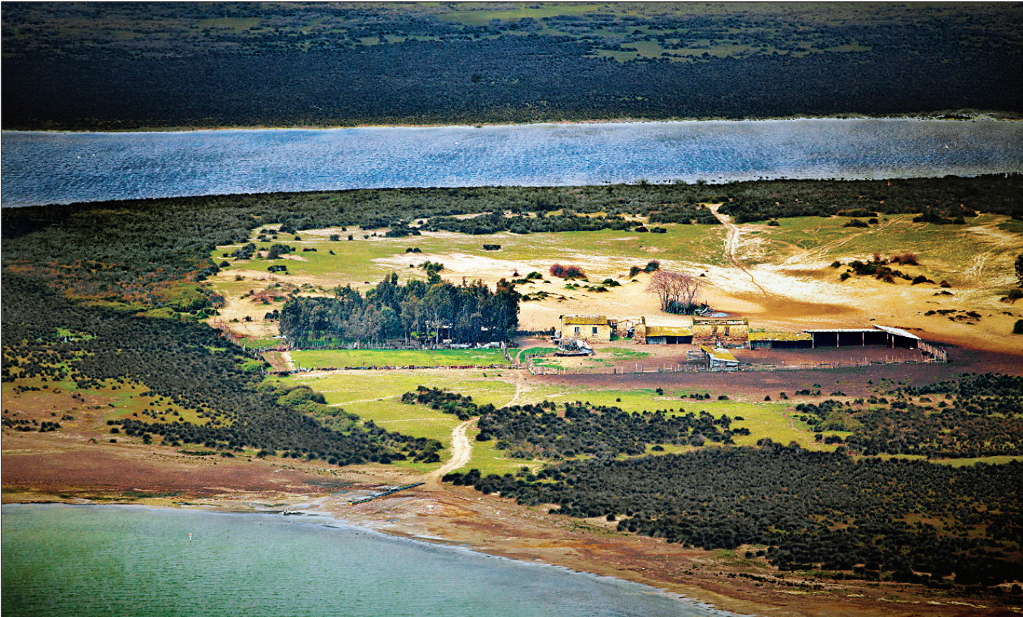
عکس همشهری زمین‌مطابق