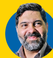
عاقبت شوراها به همه اعضا وابسته است

شورا یا پارلمان شهری، نهادی است در راستای عینیت بخشی به دموکراسی یا مردم سالاری. آیه ۲۸ سوره شورا «و امرهم بشوری بینهم» هم تأکید بر این موضوع (انجام امور با مشورت کردن) دارد. به عبارت دیگر بیانگر اهمیت نقش شوراها در نظارت و سیاستگذاری در امور شهرهاست. شورای شهر و شهرداری به مثابه ۲ بازوی نظارتی و اجرایی در مدیریت شهری هستند که تعامل میان این دو نهاد منجر به افزایش کیفیت زندگی شهروندان می شود. در تأثیر گذاری و قدمت نهاد شوراهای همین بس که سال ۵۷ به عنوان اصلی ترین و اساسی ترین رکن انقلاب اسلامی مطرح شد و سال ۷۷ هم نخستین شوراها شهر و روستا شکل گرفتند. با وجود اینکه بیش از ۴ دهه از شکل گیری شوراها می گذرد، اما این نهاد آنطور که باید و شاید به جایگاه واقعی و اصلی خود در جامعه دست نیافته است. اعضای شورای شهر تهران علاوه بر ارز یابی عدم تحقق جایگاه اصلی شورا به سوالات دیگر پیرامون همین موضوع مانند عوامل مؤثر در عدم تحقق جایگاه شوراهای ضرورت وجود شوراهای در رفع مشکلات شهر و شهروندان، راهکارهای رفع موانع و تحقق جایگاه اصلی شوراهای... پاسخ داده اند.