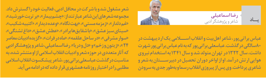
رضا اسماعیلی شاعر و پژوهشگر ادبی یاد

رضا اسماعیلی، از عباسعلی براتی‌پور، شاعر پیشکسوت انقلاب می‌گوید