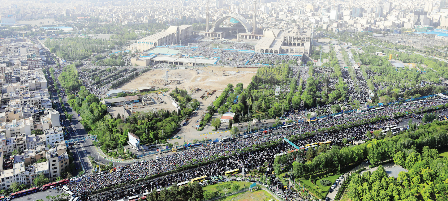
عکس پایگاه تلخاچ رسائی دفتر مقام معظم رهبری