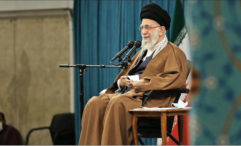
عکس پانگانه مراسم مقام معظم رهبری

رهبر معظم انقلاب: رسانه‌های بدخواه اصرار دارند که ملت ایران از اعتقاد دینی و انقلاب روی گردان شده‌اند