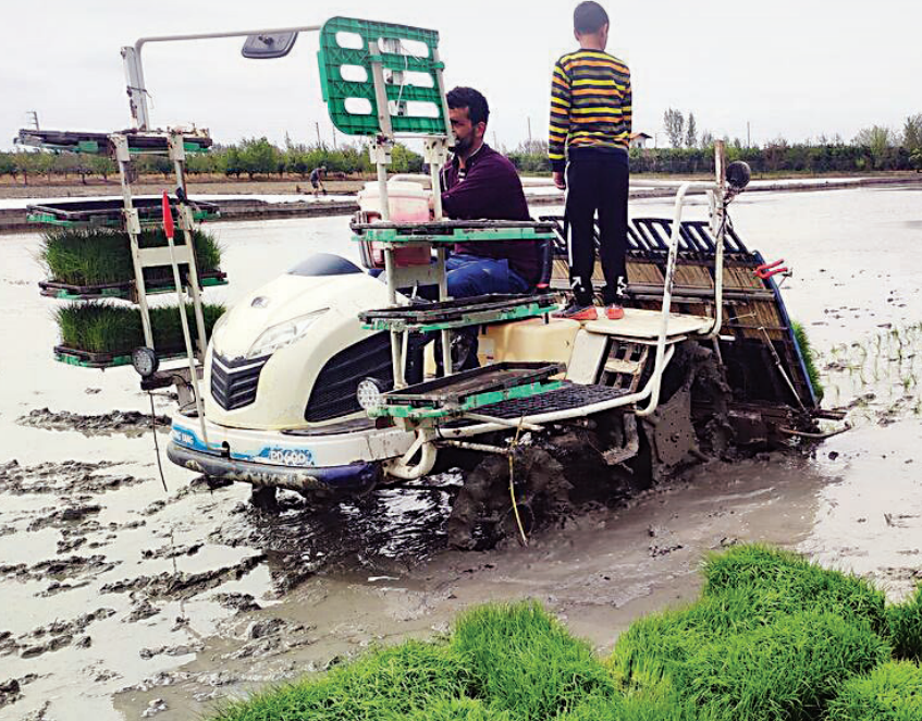
وسعت شالیکاری شمال کشور