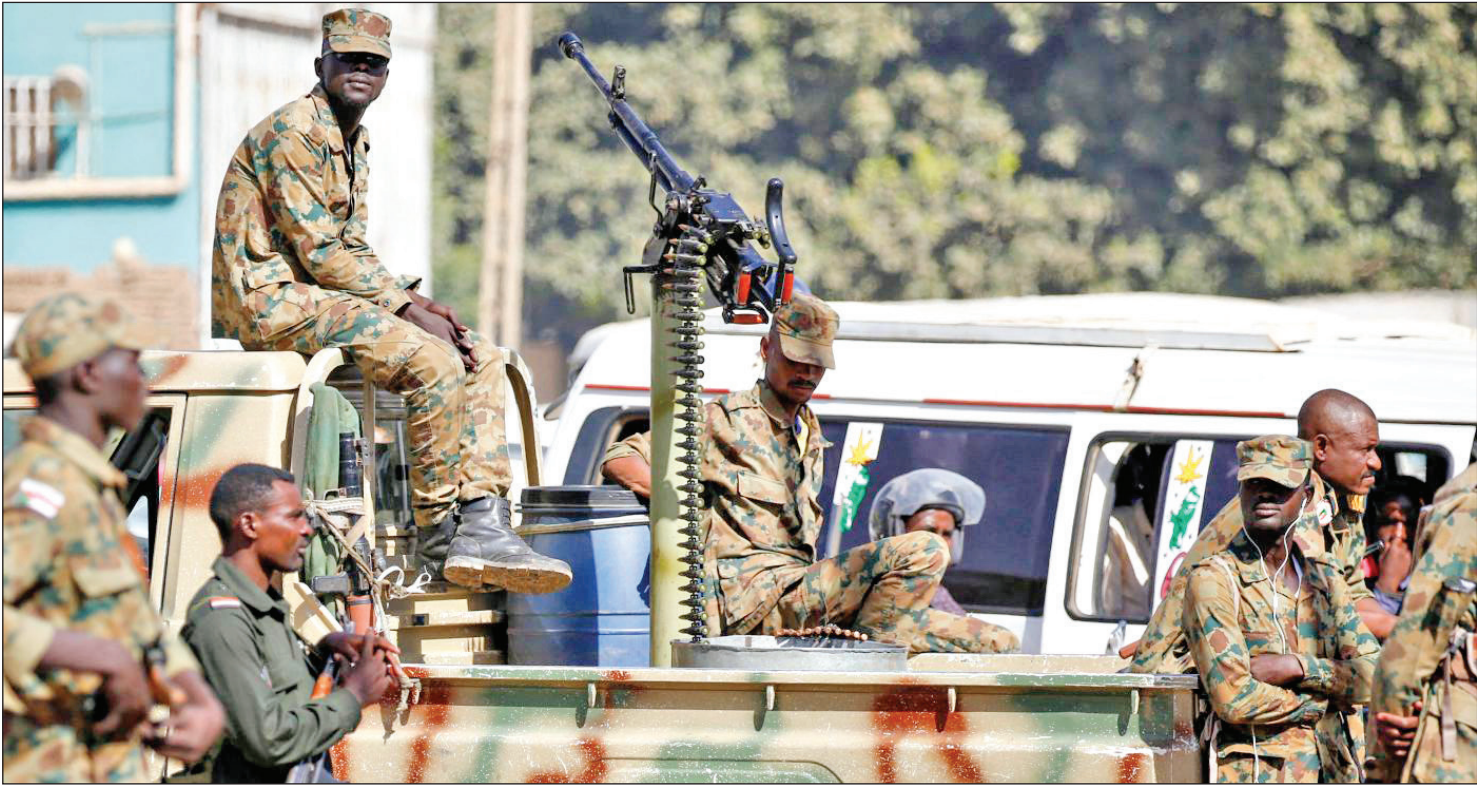
نیروهای ارتش سودان در مقابل وزارت خارجه در خارطوم، عکس: AFP