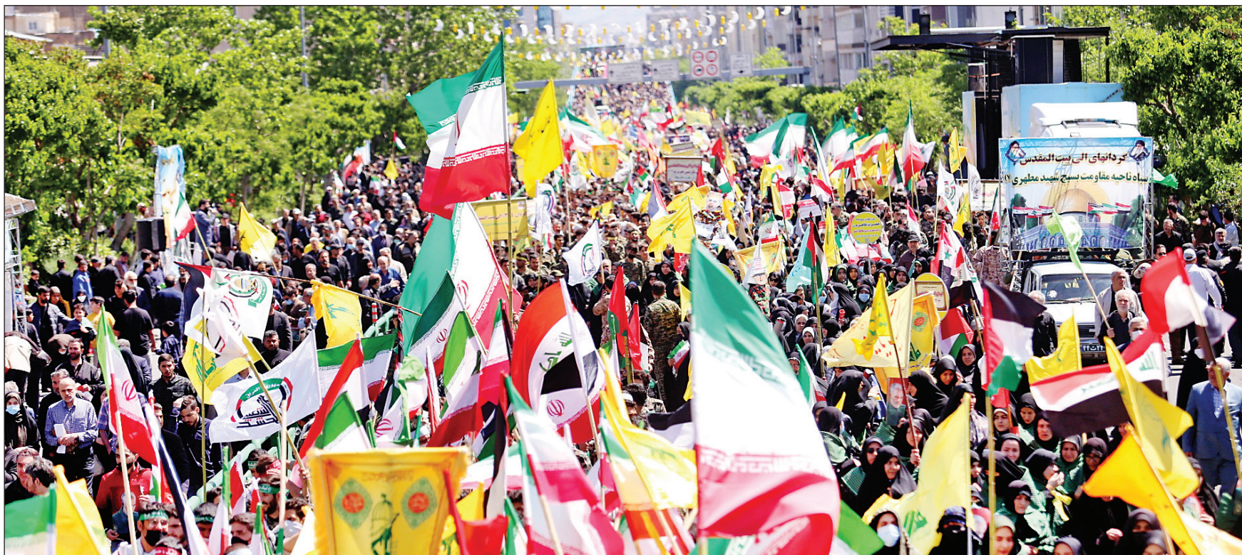
تهران / مردم روزهدار در خیابان های پایتخت چنایات روزیم صهیونیستی را در آخرین جمعه ماه مبارک رمضان محکوم کردند.

دیروز مردم روزهدار سراسر کشور با حضور حماسی در راهپیمایی روز جهانی قدس بار دیگر با آرمان رهایی قدس شریف تجدید میثاق کردند