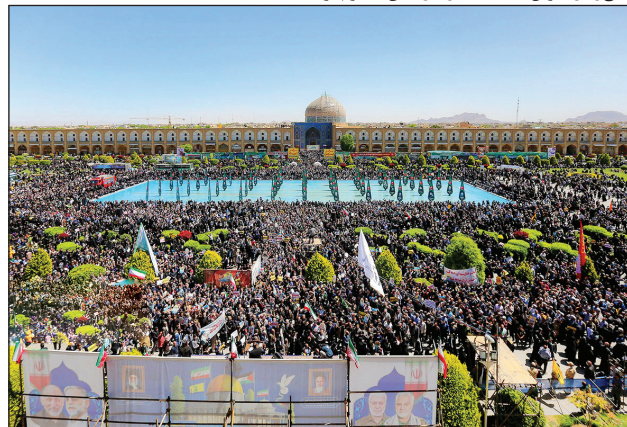
اسفهان / میدان نقش جهان دیروز میزبان روزهداران در راهپیمایی روز قدس بود.