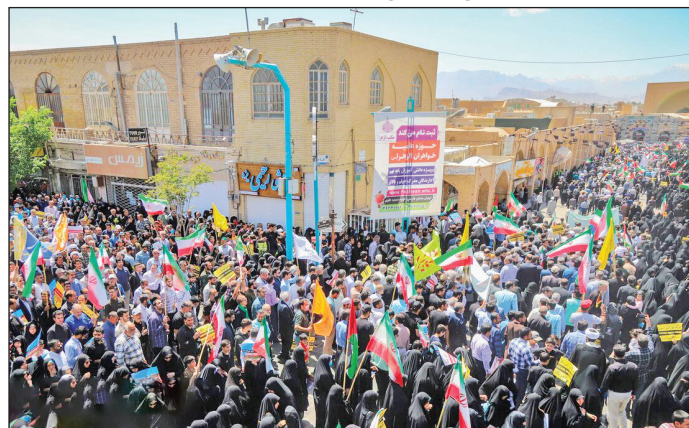
یزد / اهالی کویر با حضور گسترده در خیابان های یزد یکصد شعار مرگ بر اسرائیل سر دادند.