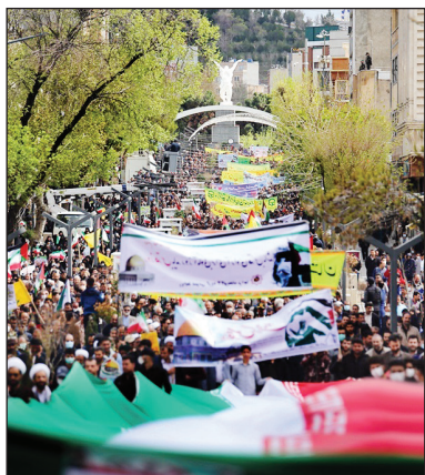
سنندج / کردستانی ها دیروز حماسه های دیگر آفریدند.