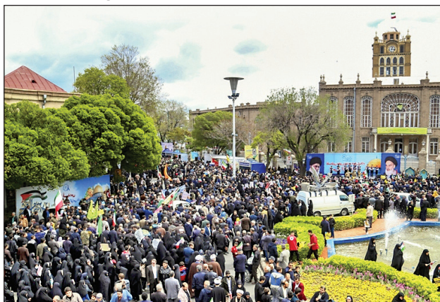
تبریز / آذری زبانان در میدان ساعت تبریز روز قدس را گرامی داشتند.