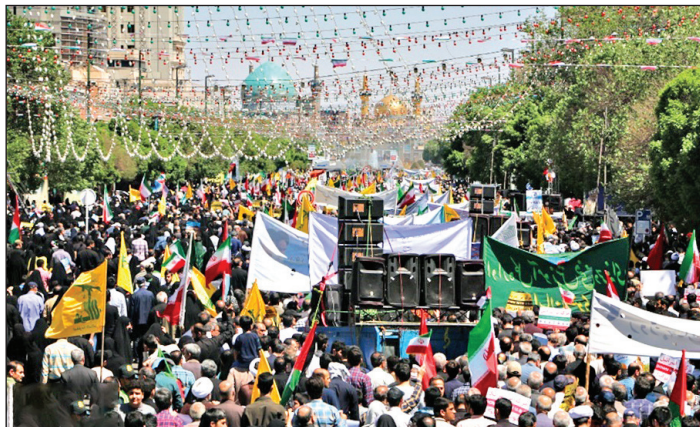
مشهد / بارگاه ملکوتی امام هشتم (ع) میعادگاه روزهداران در آخرین جمعه ماه مبارک رمضان بود.