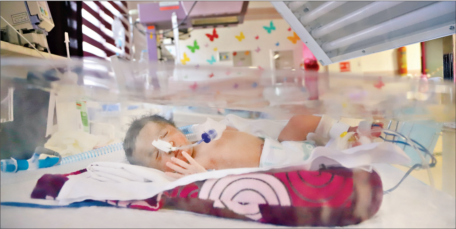
عکس‌هایمجموعی از اماکنعالم