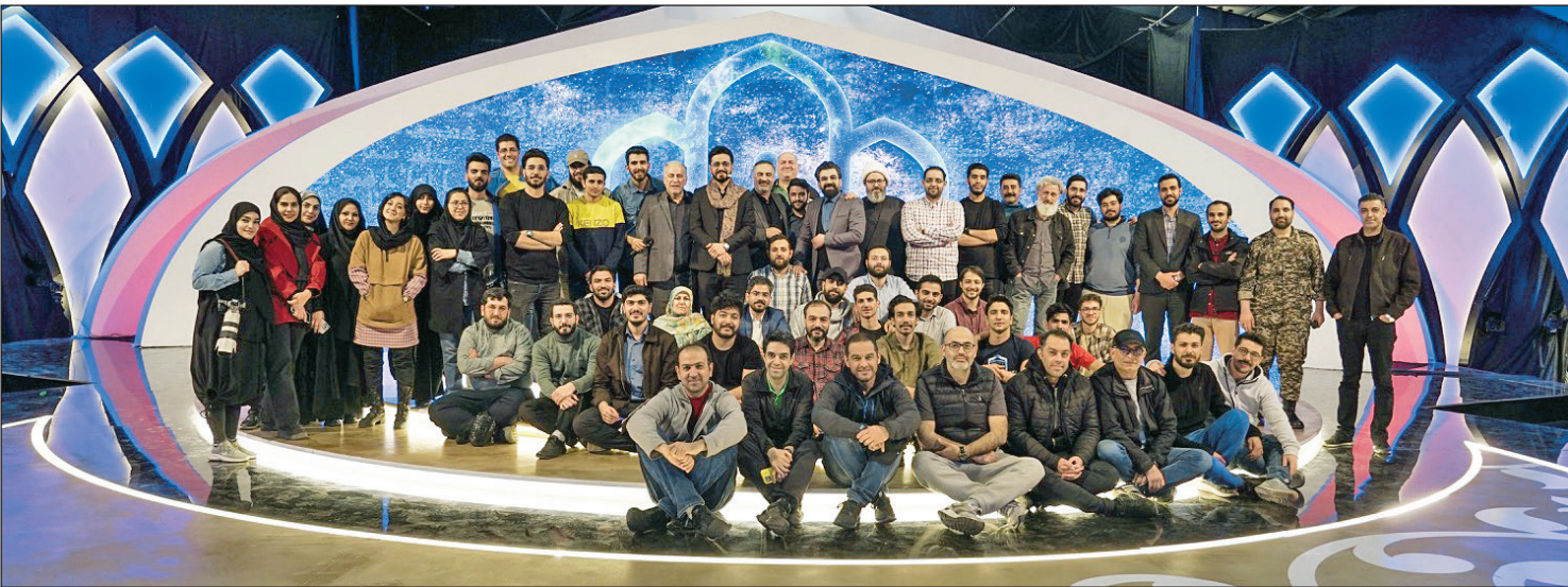
نمایی از «محفل» بزرگ‌ترین پروژه قرآنی سیما