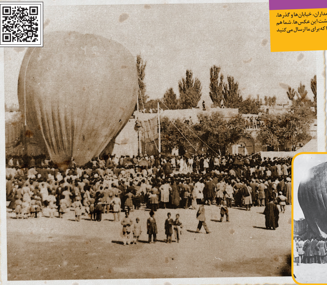
این روایت تهران را با اسکن این کیو آر کد ببینید.