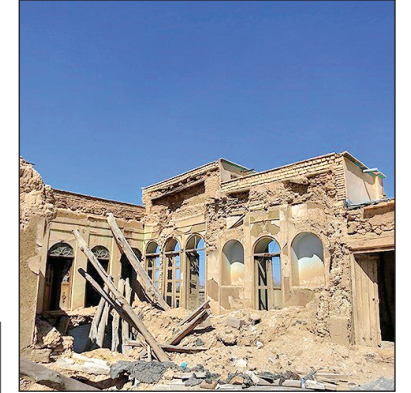
قلعه تاریخی طالخونجه

قلعه تاریخی باوری در رودی شهر طالخونجه در ۷۰ کیلومتری جنوب غربی اصفهان واقع شده و قدمت آن به دوران قاجار می‌رسد. این قلعه که به ثبت ملی هم رسیده، نیازمند توجه بیشتر برای حفظ و مرمت است.