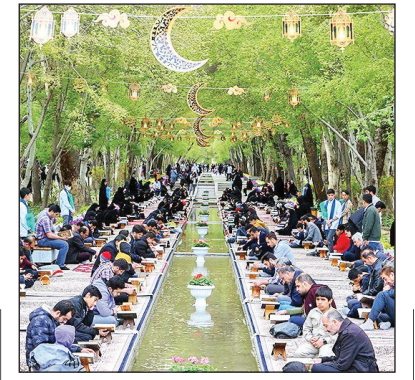
آیین جزءخوانی قرآن کریم در چهارباغ اصفهان

آیین جزءخوانی قرآن کریم در ماه مبارک رمضان هر روز از ساعت ۱۶ در گذر فرهنگی چهارباغ اصفهان برگزار می‌شود.