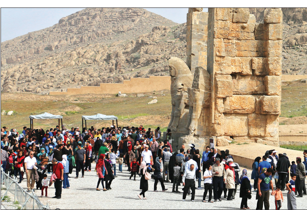
یک میلیونری از این مسافران

نوروز ۱۴۰۲ برغم برخی مشکلات اقتصادی در کشور یکی از مهم‌ترین عوامل گردش پولی و مالی با بهره گیری از سفر و گردشگری در کشور بوده و اگر به گفته تحلیلگران اقتصادی بازار سفر و گردشگری، ۶۰میلیون نفر شب اقامت در کشور اتفاق افتاده باشد و هر مسافر ۸۰۰هزار تومان تا یک میلیون تومان در کمترین میزان در طول سفر هزینه کرده باشد، گردش مالی ناشی از سفرهای نوروزی این تعداد، در کمترین میزان ممکن ۴۸هزار تا ۶۰هزار میلیارد تومان است. تنها تا پایان ۱۲ فروردین ماه به اعلام دبیر ستاد مرکزی هماهنگی خدمات سفر و مدیر کل دفتر گردشگری داخلی معاونت گردشگری، ۵۴میلیون و ۶۷۵هزار نفر شب اقامت در کشور ثبت شده است که ۱۱میلیون و ۱۲۵هزار نفر شب اقامت از استان‌های شمالی، گلستان، لرستان، خراسان جنوبی و کرمانشاه با بیش از ۸۵درصد بوده است.