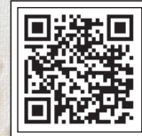
این روایت تهران را با اسکن این کیو آر کد ببینید.