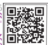
این روایت تهران را با اسکن این کیو آر کد ببینید.

بسیاری را آباد کرد، به وضع لشکرپاناش توجه خاص داشت، با وزرا و کارگزاران بی واسطه سخن می گفت و پاسخ قاصدان در سراسر کشور را شایسته می داد. دربار او محل رفت و آمد دانشمندان، ادبا و فلاسفه بود و حکیم ابوعلی سینا نیز مدتی را در گذشت. بقعه او در خیابان خاوران، خیابان شهید برادران سجادی، هشتمتری ملایری قرار دارد. بنای زیارتگاه او شامل بقعه، ایوان و رواق است. همچنین حرم به شکل مستطیل است با ۴ شاه نشین عمیق و تودار که در ۴ طرف قرار گرفته است. سیده ملک خاتون از مروجان و مبلغان شیعه بود و نسب ایشان با آئسل به امام موسی کاظم (ع) می رسید و از سادات مازندران بودند. بازسازی و رسیدگی به وضعیت این بقعه تاریخی سال ها قبل با مشارکت شهرداری تهران انجام شده است.