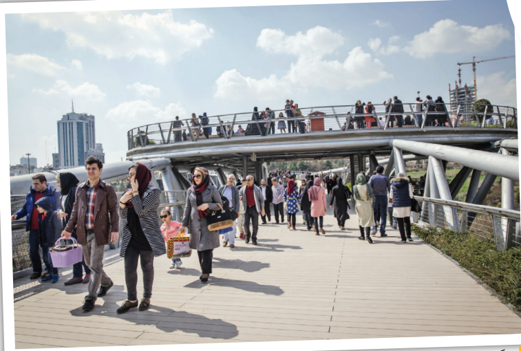
منگی همنشتری ایلسین دمیسان