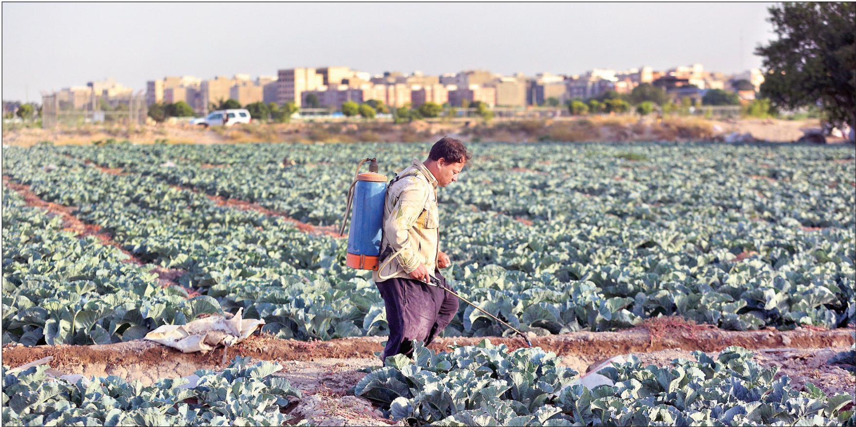
یک همشهری در حسین‌آباد