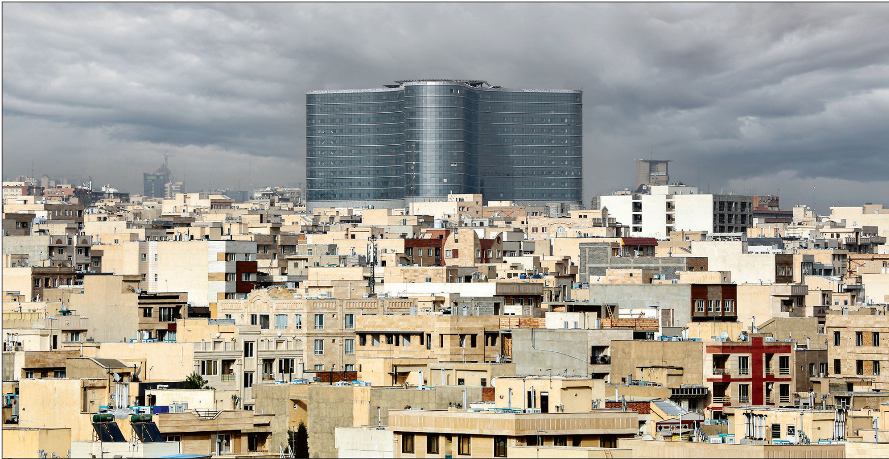
نقش همشهری‌ها در ایجاد بیابان