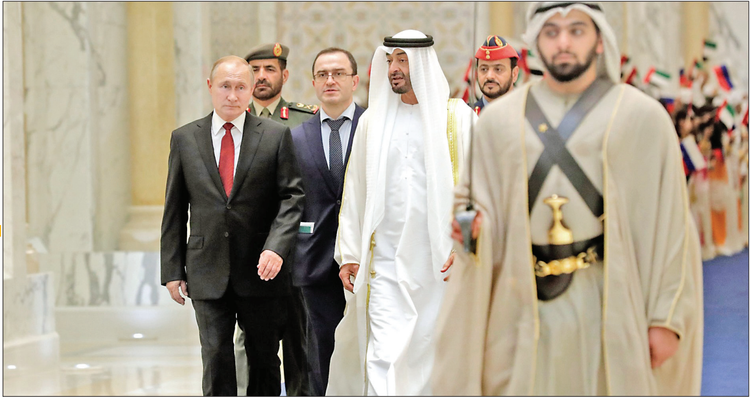
سفر رئیس‌جمهور روسیه به امارات در سال ۲۰۲۱