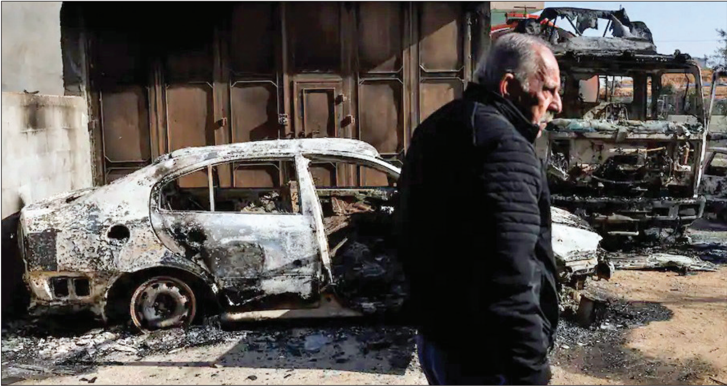
به آتش کشیدن بمباران فلسطینی‌ها در شهر حوزره جنوب نابلس، کرانه باختری