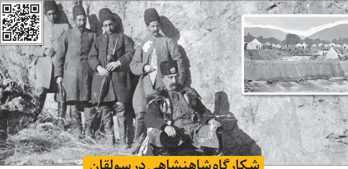
این روایت تهران را با اسکن این کیو آر کد ببینید.