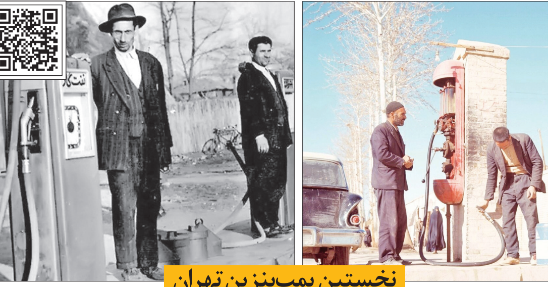
این روایت تهران را با اسکن این کیو آر کد ببینید.