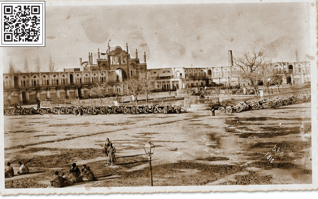
این روایت تهران را با اسکن این کیو آر کد ببینید.

روزنامه‌نگار سنگ بنای اولیه میدان امام خمینی(ره) که در گذشته به میدان توپخانه معروف بود در خندق شمالی شهر تهران قرار داشت که به برج و باروی شاه طهماسبی معروف بود. در سال ۱۲۲۹ شمسی وقتی به دستور ناصرالدین شاه و میرزا تقی خان امیر کبیر قلعه از گ را تعمیر کردند، در بیابان‌های شمالی اطراف آن عرفه‌هایی برای توپ‌ها و توپ‌چی‌ها ساختند و کار ساخت میدان که ۱۳ سال طول کشید، آغاز شد. همان زمان در پایین‌دست این میدان، مکانی برای نگهداری اسلحه و مهمات ایجاد شد که به آن «قورخانه» می‌گفتند؛ قورخانه مکانی برای استقرار نیروهای نظامی بود که ساخت آن، از آغاز صدارت امیر کبیر در سال ۱۲۲۵ آغاز و به مرور تکمیل شد. این میدان که از نخستین گذرگاه‌های تهران است ابتدا سنگ‌فرش و بعدها آسفالت شد. آنطور که در منابع تاریخی آمده این خیابان در اوایل حکومت رضاشاه، به مناسبت ورود ملک فیصل اول، پادشاه کشور عراق به تهران تمیز و آسفالت می‌شود. نام میدان در زمان