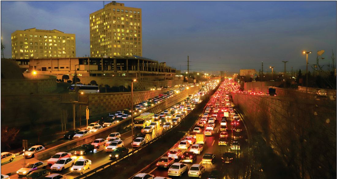
یکشنبه ۷ اسفند ۱۴۰۱، ترافیک سنگین در خیابان‌های تهران

شاید ترافیک تهران نسبت به ۳سال قبل، کمی غیرطبیعی به‌نظر بیاید. دلیل اصلی آن، این است که کرونا زندگی مردم را در ۳سال گذشته، تحت تأثیر خود قرار داده بود؛ به همین خاطر، شهروندان کمتر برای خرید و انجام امورات پایان سال با خودرو به شهر می‌آمدند. حال‌ته‌تها شرایط عادی شده است، بلکه بخشی از کارهایی که مردم نتوانسته بودند در آن سال‌ها انجام دهند را امسال در برنامه گذاشتاند.