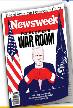
هفته‌نامه نیوزویک [آمریکا]