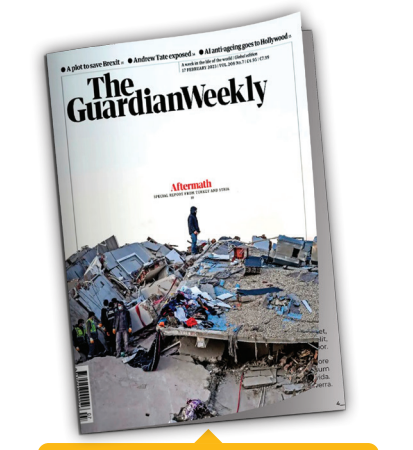
هفته‌نامه گاردین [انگلیس]

بشار اسد، رئیس‌جمهور سوریه در کمتر از یک‌سال، پس از سفر به ابوظبی، بار دیگر راهی این شیخ‌نشین خلیج فارس خواهد شد. او در این سفر قرار است برای نخستین بار در یک دهه گذشته، راهی عمان هم شود. روزنامه سعودی الشرق الاوسط با اعلام این خبر و با اشاره به تماس کشورهای مختلف عربی با دولت سوریه پس از زلزله بزرگ اخیر افزوده است: «زلزله باعث خروج دمشق از انزوا شده است. آن دسته از کشورهای عربی که می‌خواهند روابط خود با دولت سوریه را از سر بگیرند، وقوع زلزله اخیر را دلیل خوبی برای تسریع نزدیکی سیاسی از طریق تماس‌های تلفنی با انجام دیدارهای دو جانبه می‌دانند.» هنوز مقامات سوریه با مقامات عمانی و اماراتی درباره این خبر روزنامه سعودی و صحت و سقم آن واکنشی نشان نداده‌اند.