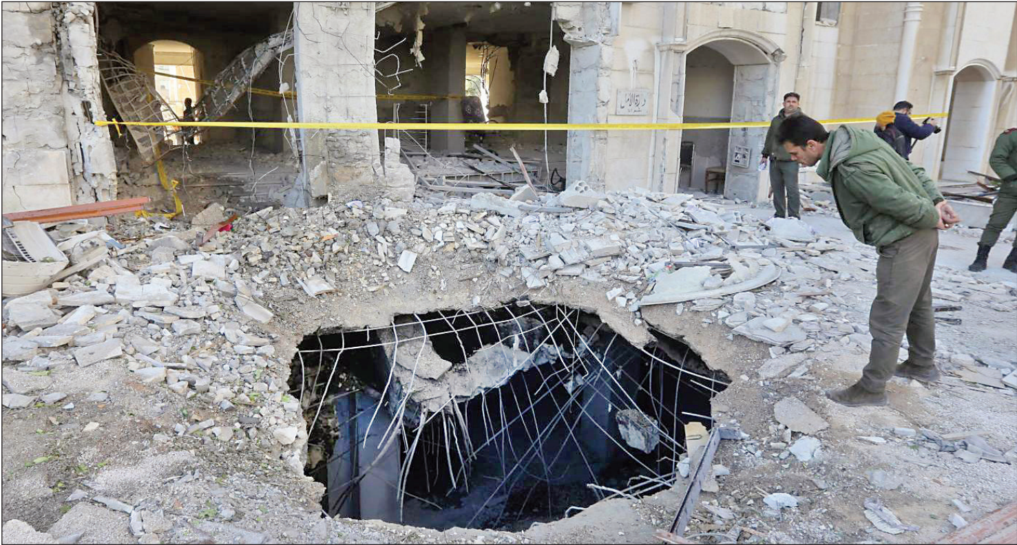
محل آسیب‌های موشک‌ها، زلزله