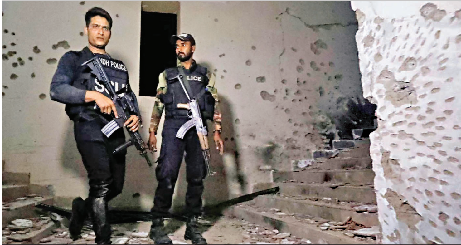
نیروهای امنیتی پاکستان در مقر پلیس کراچی