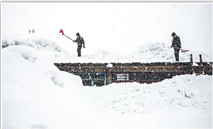
گزارش گروه ایرانتنشر

بارش باران و ذوب برف موجب جاری شدن سیل در شهرستان کوه‌رنگ چهارمحال و بختیاری شده است