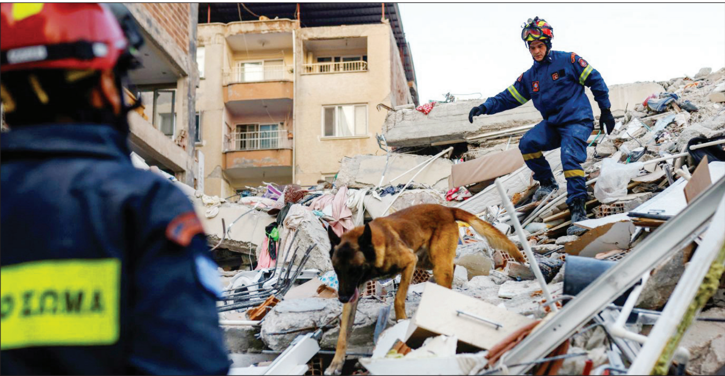
تیم امداد و نجات یونان در زیر آوارهای شهر هاتای ترکیه، عکس عکس روزنامه