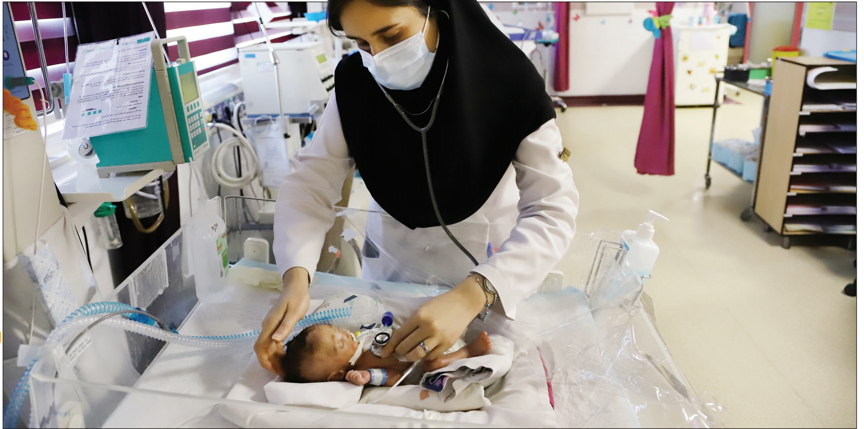
سکین هسته‌پوری / استاغلل