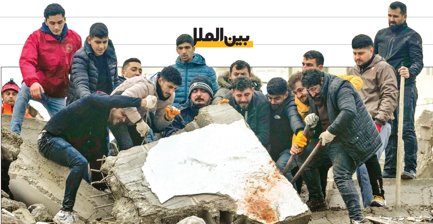
تلاش مردم برای نجات بازماندگان زلزله، شهر آنا، ترکیه.