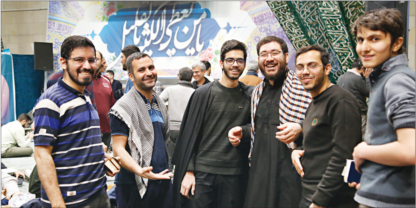
عکس شهرداری اهرمیستی