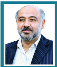
احمد میدردی اقتصاددان و معاون سابق وزارت تعاون، کار و رفاه اجتماعی