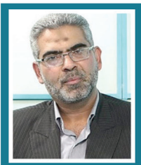
حسین صمصامی اقتصاددان و سرپرست سابق وزارت امور اقتصادی و دارایی