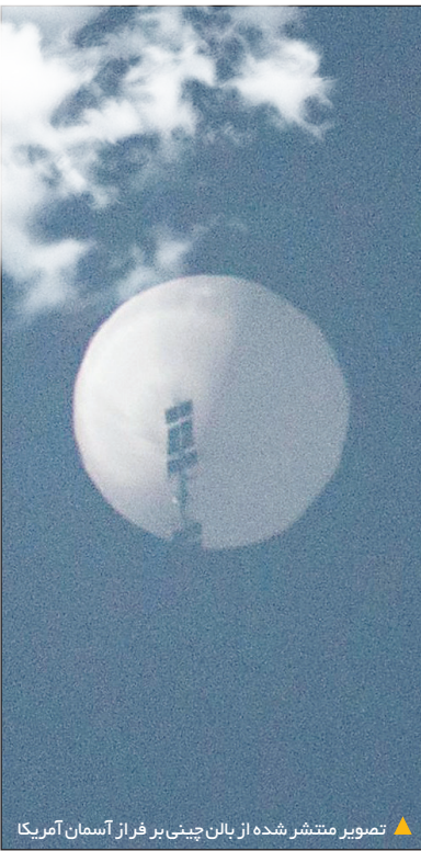
▲ تصویر منتشر شده از بالن چینی بر فراز آسمان آمریکا