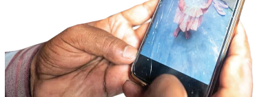
طرح همشهری: ایجاد مشکلی

وقتی که والدین این دختر زیبا، در بیمارستان متوجه شدند که او دیگر از دست رفته، برای نخستین‌بار در زندگی‌شان با یک مسئله که به آنها پیشهاد شده بود مواجه شدند: احیای اعضای بدن روی، یک جراح که در این زمینه فعالیت می‌کرد، در بیمارستان این پیشنهاد را به والدین روی داد و پدر او هم، بالاخره بعد از یک شبانه‌روز کلتناز رفتن، با این کار موافقت کرد. بلافاصله ۲کلیه روی به یک نوجوان ۱۴ساله پیوند زده شد و این نوجوان به زندگی بازگشت. این پسر جوان، ۶سال در صف دریافت کلیه بود. کبد روی هم به یک پسر ۶ساله پیوند زده شد. در پچه‌های قلب او، به ۲ کودک یک و ۴ساله داده شد و قریه‌های این دختر معصوم هم بینایی را به ۲ انسان ۳۵ و ۷۱ساله بخشید. این پیوندها، مثل بمب در هند صدا کرد و کشوری را که با مسئله‌های عضو بیگانه است، با یک پدیده حیات‌بخش آشنا کرد. در هند، هر ۱۳دقیقه یک نفر به‌خاطر جراحی‌های سنگین سر فوت می‌کند و می‌توان اعضای بدن این افسراد را به دیگران هدیه کرد. بسا این حال، رقم اهدای عضو در کشور ۱،۴ میلیارد نفری هند، از نظر آماری صفر است و سالانه حدود ۸۰۰نفر بیشتر نیست. اما داستان روی، اوضاع را تغییر داده است و در طول ۱۰ماه، در دهمی نو به اندازه ۵سال اهدای عضو ثبت شده است. در سراسر هند هم، اهدای عضو در یک سال گذشته، بیشتر از هر سال دیگری در تاریخ این کشور بوده است. دکتر دیپاک گوپتا، جراحی که پدر روی را متقاعد کرده بود تا با اهدای بدن او موافقت کند، گفته که اهدای اعضای این دختر معصوم، باعث شده تا نقطه عطفی در این زمینه در هند ایجاد شود و پیش‌بینی کرده که روند اهدای عضو در این کشور، به‌زودی اوج خواهد گرفت و افراد زیادی دوباره از مرگ به زندگی بازخواهند گشت.