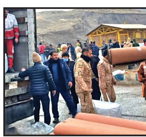
موکت یکی از مهم‌ترین نیازهای مردم زلزله‌زده‌ای است که در چادر زندگی می‌کنند. سرمای شدید هوا سبب می‌شود زمین یخ شود. در این شرایط موکت می‌تواند به کمک آنها بیاید.