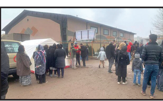
توزیع دارو به زلزله زدگان خوی توسط هلال احمر در حال انجام است.